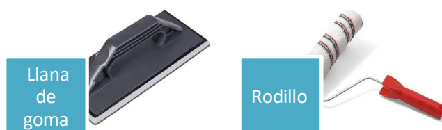
Llana de goma