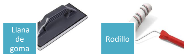
Llana de goma

Herramientas de aplicación Rayston Epoxy 100: